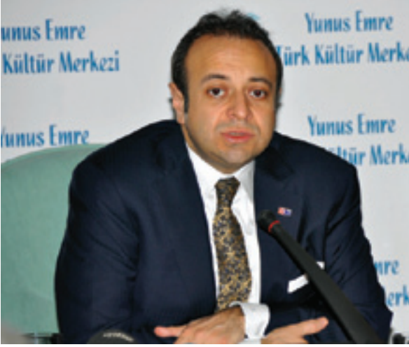
Egemen BAĞIŞ Devlet Bakanı