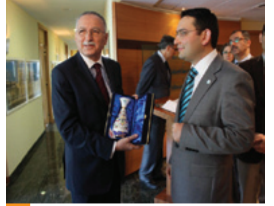
Prof. Dr. Ekmeleddin İHSANOĞLU İslam Konferansı Örgütü Genel Sekreteri

“Ülkemizin son yıllarda ileriye attığı büyük hamlelerden birisi olarak bu kurumun gelişmesini ve büyümesini temenni ederim.”