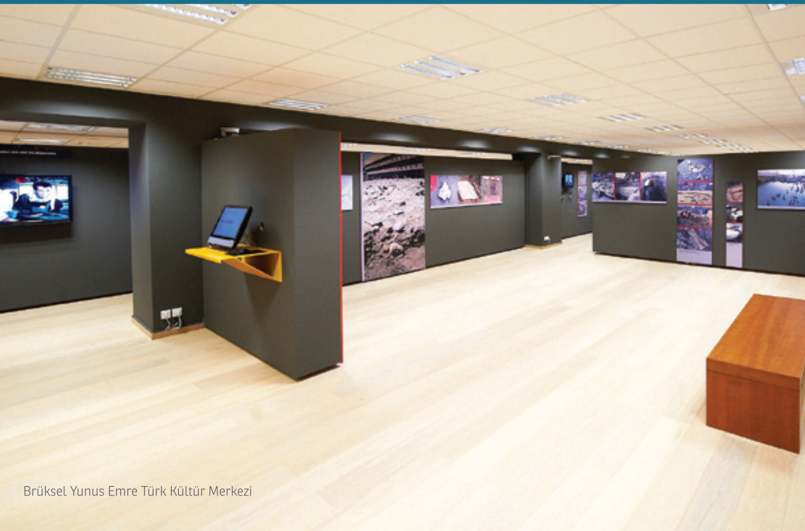
Brüksel Yunus Emre Türk Kültür Merkezi